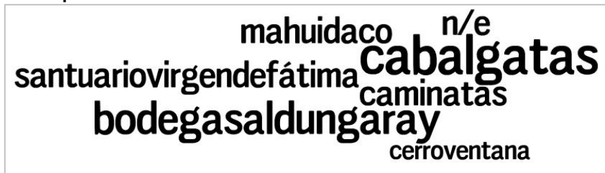
Figura N° 4. Principales excursiones 8

*n/e: no específica, implica que los entrevistados han realizado gran parte de las visitas guiadas y excursiones mencionadas en la encuesta.