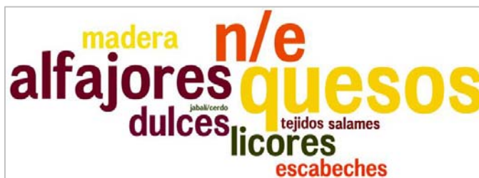
Fig. N° 5. Principales productos regionales consumidos

*n/e: no especifica, implica que los entrevistados han probado/consumido gran parte de los productos mencionados en la encuesta (dulce, alfajores, licores, quesos, etc.).