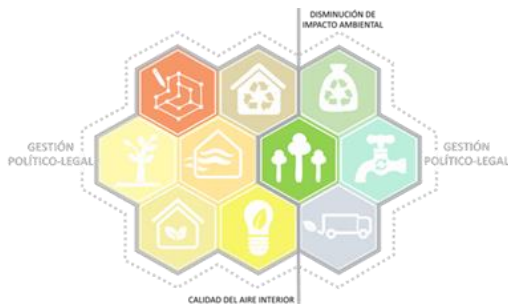
Figura 3: Esquema de relaciones con íconos representativos asignados a cada aspecto detectado.

2.1.b. Ponderación de Estrategias de Diseño Sustentable: El estudio de algunos casos de sistemas vigentes de evaluación de la sustentabilidad de edificios, ya mencionados en el punto anterior, resultó fundamental para la búsqueda de criterios incipientes de sustentabilidad que pudieran tener vigencia en el NEA, así como para lograr una identificación de los parámetros actuales de sustentabilidad en que se basan los sistemas más influyentes de evaluación edilicia (figura 3).