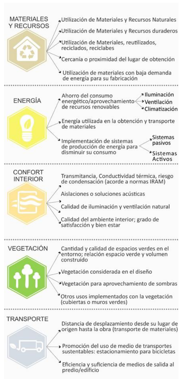
Figura 4: Sistema y categorización de parámetros e indicadores de sustentabilidad.

2.2.b. Confección de instrumentos (planillas) para su valoración y puntuación: A partir del sistema de indicadores definido se confeccionaron planillas modelo (tabla 1), que definan un método de valoración o puntuación para poder estimar el grado de incidencia de cada