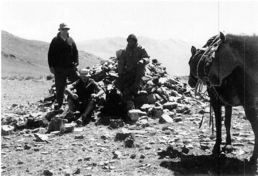
Figura 2. Abra de Las Tomas (o de Tomás) (4050 m). Al fondo los Nevados de Chuscha. (Desde esta abra se descende a las ruinas de los Quilmes). La apacheta mide 3 m de diámetro y 1,60 m de altura, aproximadamente. Hay ofrendas modernas (hojas de coca, cigarrillos, botellas que contuvieron alcohol, etc.). (Foto A.B.N., 22 abril 2003).