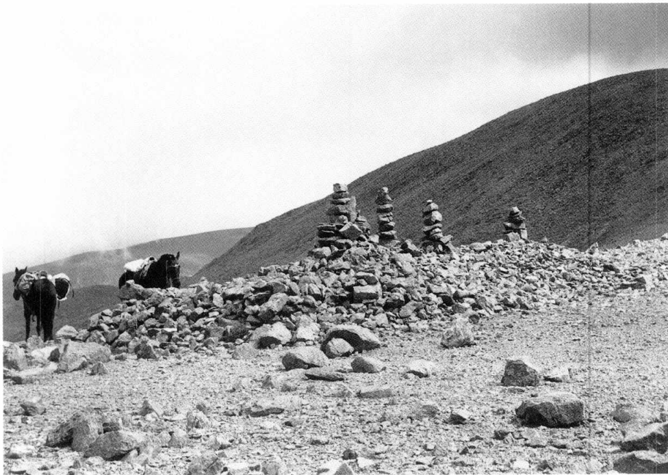
Figura 4. Gran "apacheta" central (¿restos de una plataforma?) del Portezuelo de Pisca-Cruz.