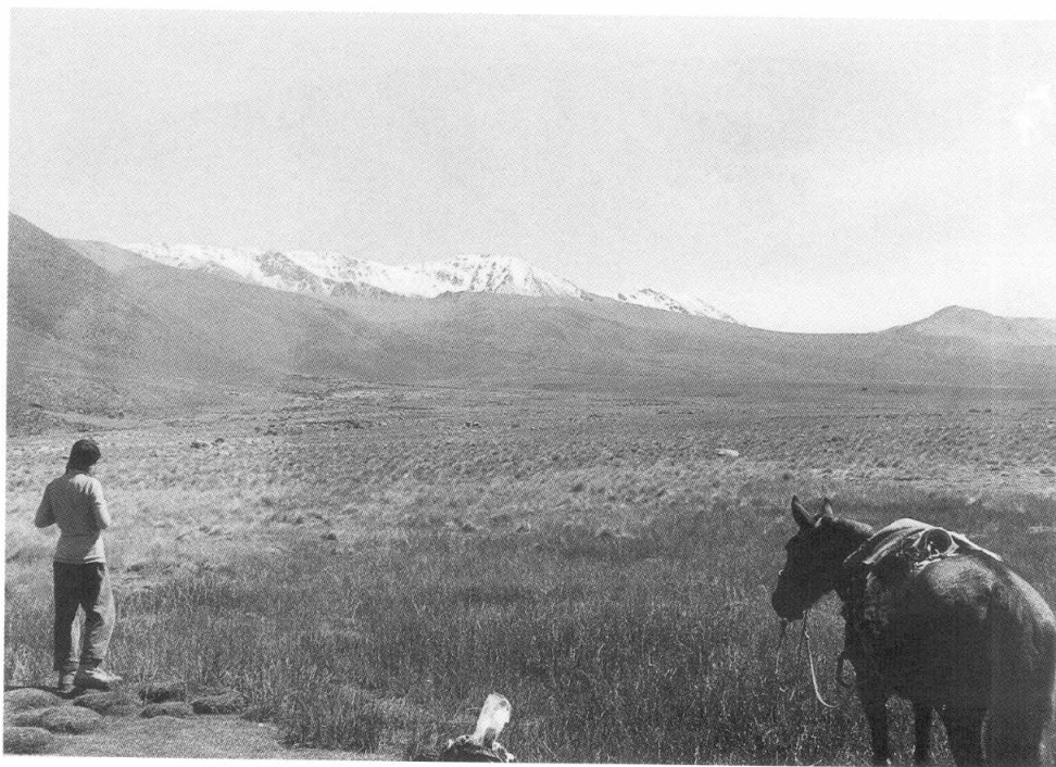
Figura 1. La cumbres del Nevado de Chuscha, vistas desde el alto valle del Cajón.