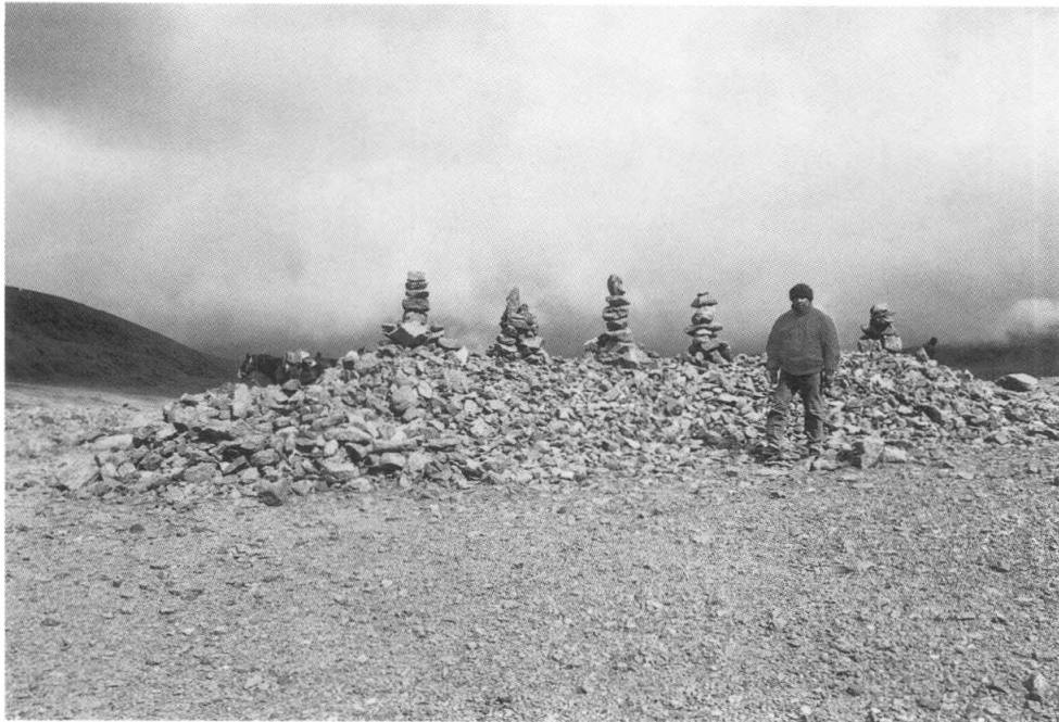
Figura 5. Otra vista de la gran "apacheta", que conserva seis mojones (modernos o reconstruidos) levantados sobre la misma.