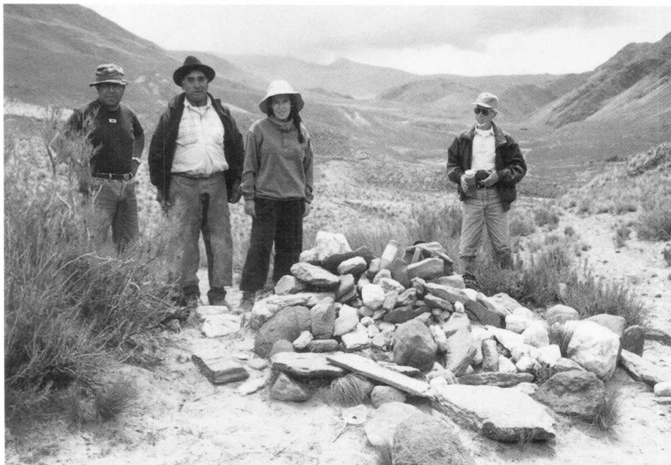
Figura 6. Apacheta ubicada en el Abra Colorada (aprox. 3200 m), en el camino entre San Antonio y La Ovejera. Se observan en la foto los miembros de la expedición de marzo de 2002. (Foto A. Beorchia).