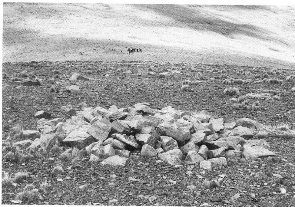
Figura 2. Resto de una de las construcciones del abra o Portezuelo de Pisca-Cruz.