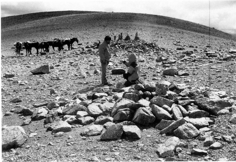
Figura 3. Sector central de las construcciones del Portezuelo.