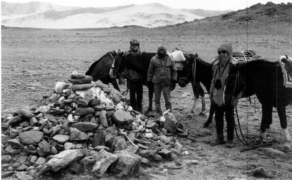
Figura 1. Abra del Hombre Muerto (4300 m). La apacheta mide 2 m de diámetro por 1,20 m de altura aprox. Arriba, extrema izquierda, la cumbre plana de 5175 m de los Nevados de Chuscha de donde se extrajo la "momia". La apacheta contiene ofrendas modernas en superficie. (Foto A.B.N., 18 abril 2003).

Donde hablamos de las apachetas aledañas a los Nevados de Chuscha