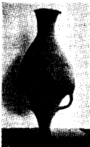
Fig. 3. - Cántaro de forma griega de gran tamaño, procedente de Inca-Llacta, Cochabamba.

La arcilla utilizada en todas estas piezas es de un tono rojizo por lo general, pero hay una minoría de piezas de color gris, claro y oscuro; las piezas de los yacimientos del Altiplano tienen un antiplástico de mica, que no se observa en Cochabamba. No existe, con propiedad, un verdadero pulimento del exterior de las piezas, por más que presentan un esmerado alisamiento, hecho con esteque. Se exceptúan, y tienen verdadero pulimento, algunos jarros con engobe rojizo brillante y paredes muy delgadas, que deben ser más recientes.