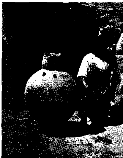
Fig. 2. - Cántaro para agua o chicha, con dos pequeños pezones al frente. Cliza.

chicas dispuestas en forma doble, con un canal de comunicación entre los dos recipientes; abundan los platos y tazas ovales y las fuentes aplanadas. Algunos platos hondos presentan tres o cuatro puntas salientes en sus bordes.