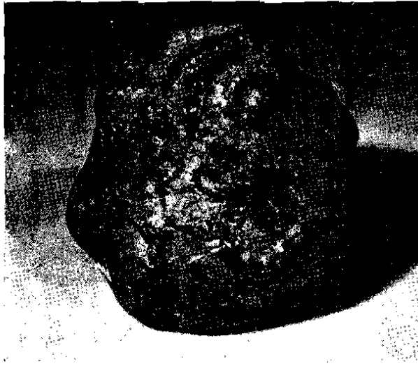
Fig. 5. - Imagen de una diosa de Cliza, con pechos en su parte posterior.

No obstante lo dicho, las figuras femeninas son bastante abundantes y se distinguen por una característica sorprendente: en su parte superior, en forma de tocado, o a los costados de la cara y del cuerpo, aparecen uno o más pechos bien modelados, en orma totalmente naturalista. Tres o más diosas tienen esta caracterización.