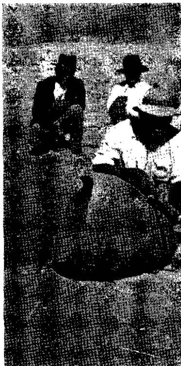
Fig. 1. - Gran urna funeraria con la parte superior rota. Cliza.

Existen en ella, en primer lugar, y en contra de toda nuestra creencia anterior (basada en los datos falsos de Bennett) que suponía que las urnas funerarias no eran andinas sino amazónicas, varios tipos de urnas funerarias (sin pintura siempre), tanto para adultos como para criaturas, de boca muy ancha y base pequeña; las ollas comunes también se han usado como urnas.