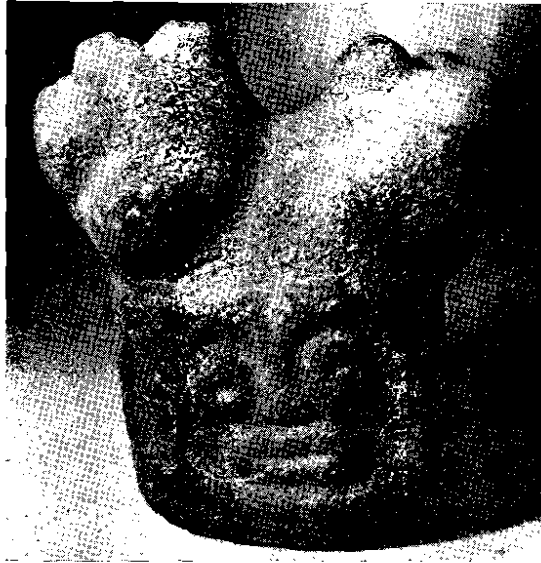
Fig. 6. - Imagen de una diosa de Cliza, caracterizada por un tocado en forma de múltiples pechos, repartidos en dos grupos.

duda de su existencia, y nos dice que lo cree invención reciente de los indígenas para congraciarse con los españoles, señalando que ellos también creían en la Trinidad.