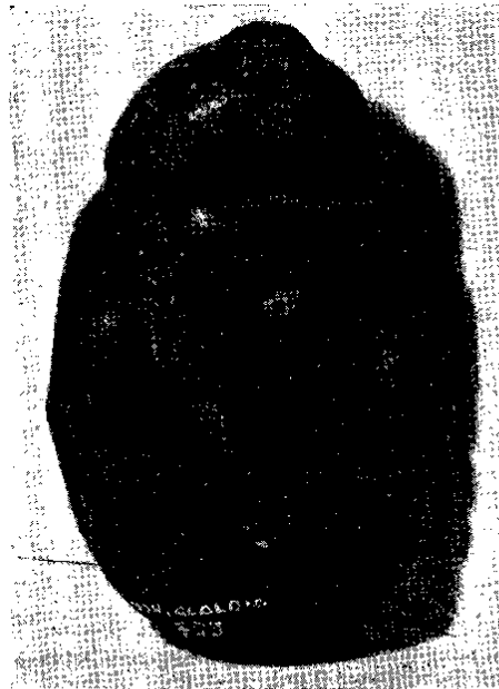
Fig. 7. - Imagen de una diosa, de Cliza, con un gran pecho por tocado.

Hay otras varias clases de dioses y diosas, como ser un tipo de ídolos cuya cara aparece siempre labrada en una piedra angular, extendiéndose la cara a sus lados; otros con los ojos bien redondos, en vez de oblicuos y delgados, etc.