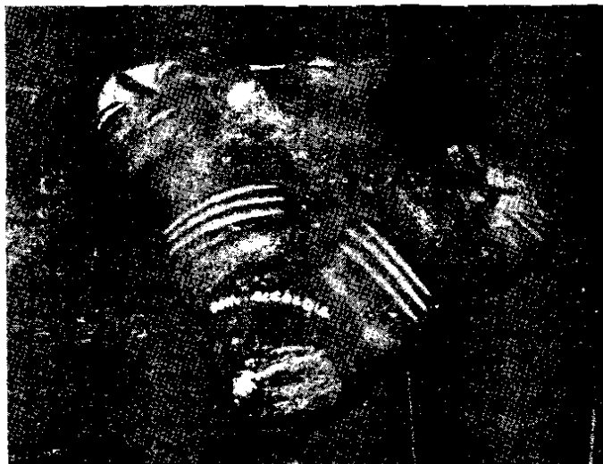
Fig. 8. - Representación de la deidad trinitaria de Cliza; tres cabezas sobre un solo cuerpo. La cabeza central rota.

la primera con agricultura y cerámica que se ha presentado en el Altiplano (la existencia de la agricultura está bien probada por las hojas de azada). Otra prueba fundamental es el hecho de que la cerámica sin pintura que aparece en los pozos de sondeo hechos en Tiahuanaco, por Bennett y Kidder, corresponde completamente por su estilo de pasta y formas a la cerámica de los yacimientos de Oruro; una de sus características es el uso abundante de la mica como antiplástico, cosa que no se usa en la cultura tiahuanacota. La fase de Cochabamba ya no usa mica.