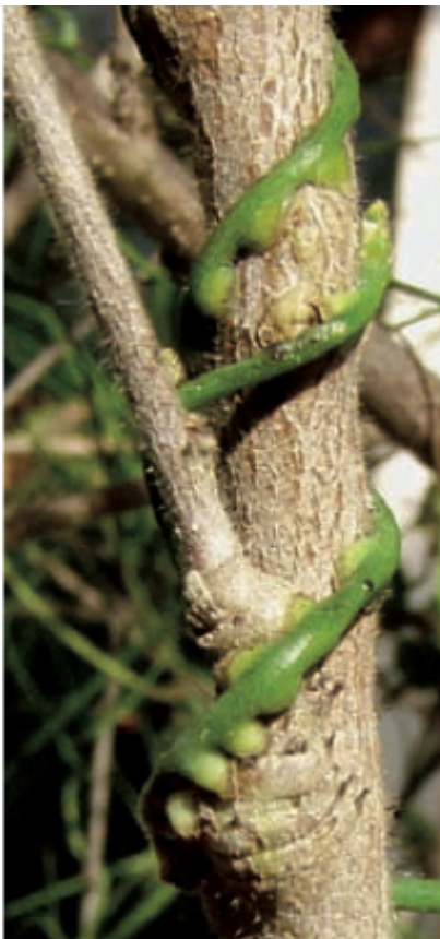
Figura 1: foto de un haustorio. Planta parásita Cassytha .

Las plantas parásitas tienen la habilidad de alimentarse directamente de otras plantas. Para ello, invaden los tallos o raíces de plantas hospedadoras mediante raíces modificadas llamadas haustorios (Figura 1). Éstas les permiten conectar su tejido vascular con el de la planta hospedadora posibilitando el intercambio de nutrientes, agua e incluso moléculas como ARN y ADN.