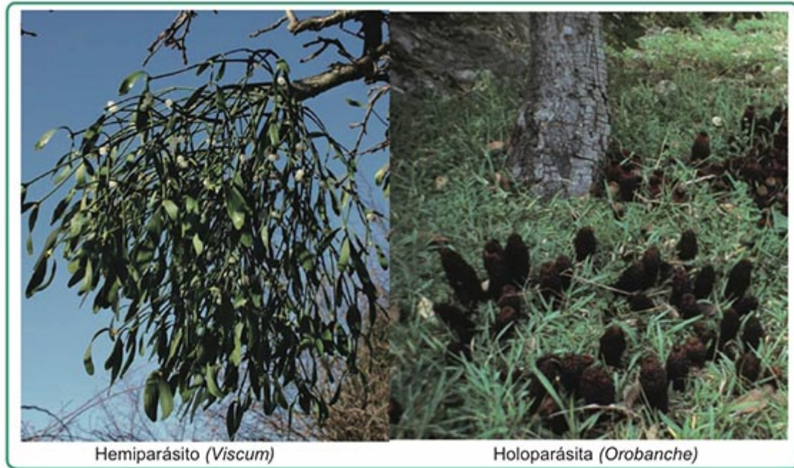
Figura 2: fotos de plantas hemiparásitas y holoparásitas.

horizontal (TGH). En los últimos años se han detectado numerosos eventos de transferencia de genes desde las plantas hospedadoras a las plantas que las parasitan. Esto sugiere que el parasitismo podría facilitar la TGH, aunque el alcance y las repercusiones de este fenómeno en las plantas parásitas todavía no están claros.