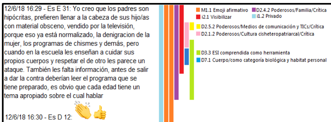
Figura 3: Ejemplo de análisis multidimensional de constructos analíticos simultáneos.

Aunque consideramos pertinente los análisis de co-ocurrencia por pares de constructos analíticos a los fines de simplificar la presentación y facilitar la comprensión de los mismos, nos parecía valioso mostrar en este fragmento de la etnografía virtual los múltiples análisis posibles y la riqueza de poder pensar esta propuesta metodológica desde diversas dimensiones con constructos analíticos diferentes, pero co-ocurrentes.