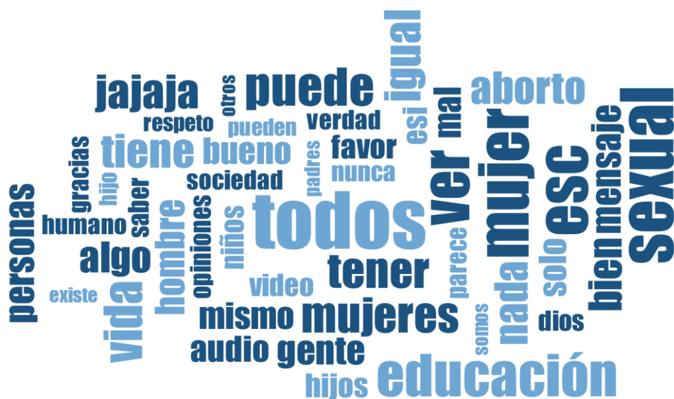
Figura 1: Nube de palabras de los y las adolescentes Atlas Ti v8.

Más allá de que era esperable la aparición de la palabra “ todos ”, ya que es una palabra frecuentemente utilizada en el español, podríamos hipotetizar que el comportamiento del grupo de adolescentes otorga importancia a la idea de conjunto o de grupo de pertenencia. Este aspecto es observable a lo largo del discurso y particularmente en el momento de conformación del mismo, en el cual se utiliza el dispositivo para compartir experiencias personales y para buscar similitudes entre sí. Además, como segunda palabra más frecuente en la lista, encontramos “ sexual ”. Este término tiene connotaciones importantes para el grupo de adolescentes, aspecto que podría tener relación con el momento histórico-evolutivo que se encuentran viviendo. La sexualidad es uno de los puntos de mayor interés para todo y toda adolescente, por lo que es previsible que aparezca como palabra muy frecuente.