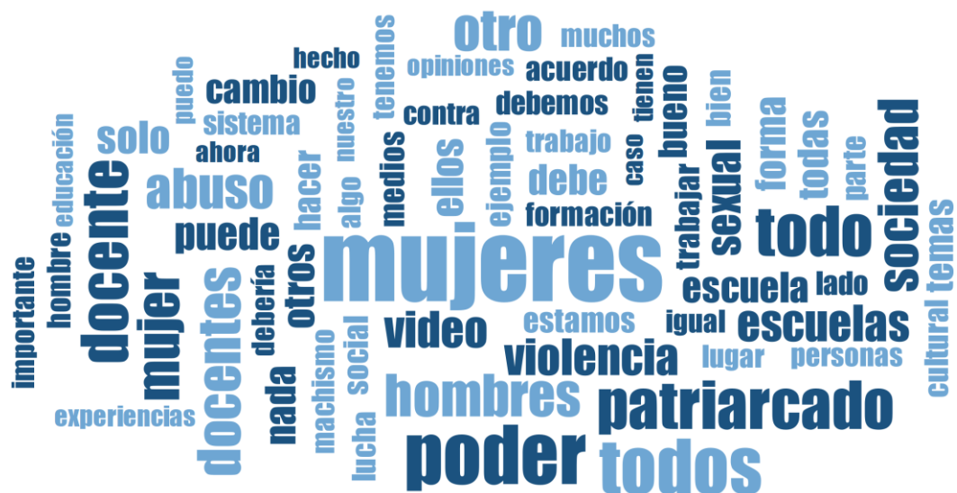
Figura 2: Nube de palabras de los y las docentes Atlas Ti v8.

En cuanto a la nube de palabras que surge del análisis del grupo de docentes, observamos “ mujeres ” como la palabra más mencionada durante la conversación. Este resultado muestra cómo la mujer, a través del empoderamiento, ha logrado