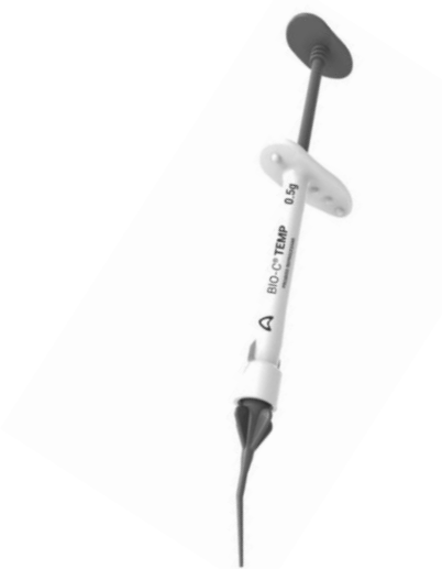
Fig. 2 Bio-C Temp. Medicación biocerámica intraconducto.

Se eliminó la obturación, se anestesió con TOTALCAÍNA FORTE (Carticaína Clorhidrato 4 % -L-Adrenalina 1:100.000, Laboratorio Bernabó) y se aisló el elemento dentario con goma dique. Se realizó la apertura con fresa de diamante redonda N° 2, se rectificó el acceso y se determinó la presencia de un conducto. Se realizó cateterismo y glide patt con una lima k 10 (Dentsply Maillefer, Switzerland), corroborando la permeabilidad del conducto; posteriormente se utilizaron fresas gates glidden 2 y 3 para el tercio coronario. Se determinó una longitud de trabajo, mediante el uso de localizador apical Propex Pixi (Dentsply – Maillefer, Switzerland), de 16 milímetros. Se procedió a conformar el canal radicular con limas k (Dentsply - Maillefer Switzerland) hasta un calibre número 50, quedando conformado el tope apical. Como irrigante se utilizó hipoclorito de sodio al 5,25% (Tedequim S.R.L. Industria Argentina) durante todo el procedimiento y al final fue activado con punta ultrasónica. Una vez finalizada la limpieza y conformación, se secó el conducto radicular con cono de papel número 50 (Adsorbent paper point, Meta Biomed) a longitud de trabajo. Se decidió colocar como medicación intraconducto un material biocerámico Bio-C Temp (Angelus, Brasil) (Fig. 2) debido a su liberación constante de iones calcio, fácil remoción y excelente visualización radiológica (Fig. 3).