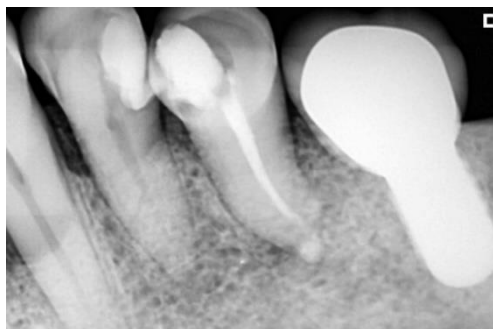
Fig. 5 Radiografía de control a los 60 días.

Se realizó un control a los 60 días donde se observó ausencia de signos y síntomas clínicos, desaparición del tracto sinusal y reparación a nivel apical. (Fig. 5)