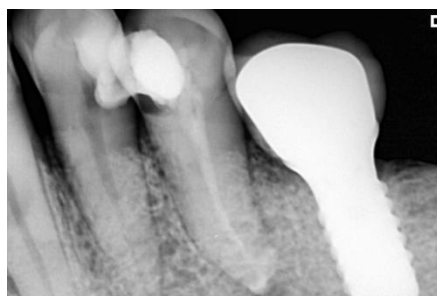
Fig. 3 Radiografía posterior a la aplicación de la medicación intraconducto. Observe radiopacidad y escurrimiento del material.