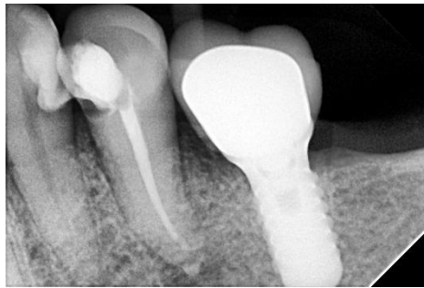
Fig. 4 Radiografía postoperatoria inmediata.

A los 15 días se programó una nueva cita donde evaluamos la ausencia de signos y síntomas, posteriormente se eliminó el material dentro del conducto radicular con irrigación con hipoclorito de sodio al 5,25% y se reinstrumentó el conducto con la última lima utilizada para la preparación, en este caso una número 50. Se procedió a la obturación del mismo. Se probó un cono de gutapercha #50 .02 a 16 milímetros asegurándonos de que atasque en la constricción apical. Se llevó cemento sellador Bio-C Sealer (Angelus, Brasil) 3 mm antes de la longitud de trabajo y se realizó obturación convencional mediante condensación lateral utilizando conos accesorios MF (Gutta Percha points, Meta Biomed) (Fig. 4).