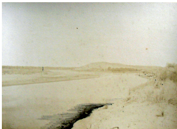
Figs 6 y 7