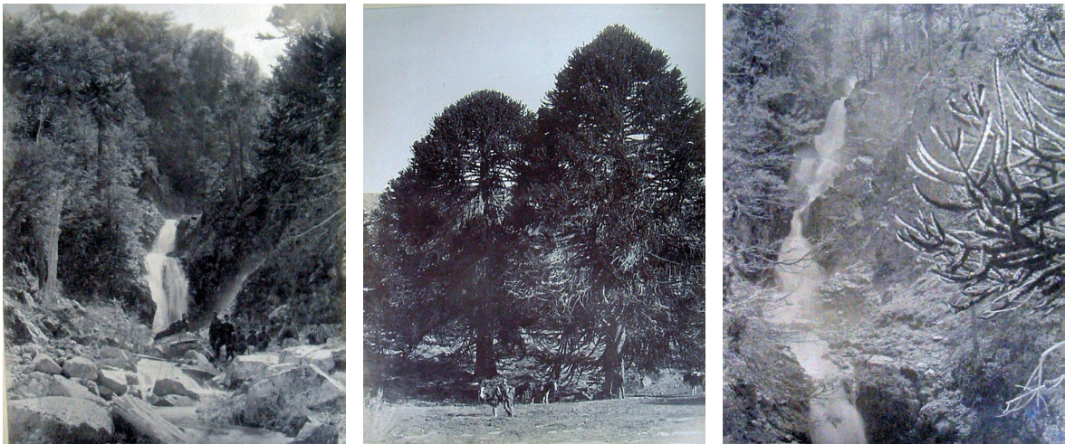
Figs 15, 16 y 17

Esta explicitación se omite y se disimula en las vistas deshabitadas del álbum de Encina y Moreno, cuya existencia se pretende “originaria” y por lo tanto previa a la visibilidad que le da la captación fotográfica. Resulta interesante que Morelli haya re-