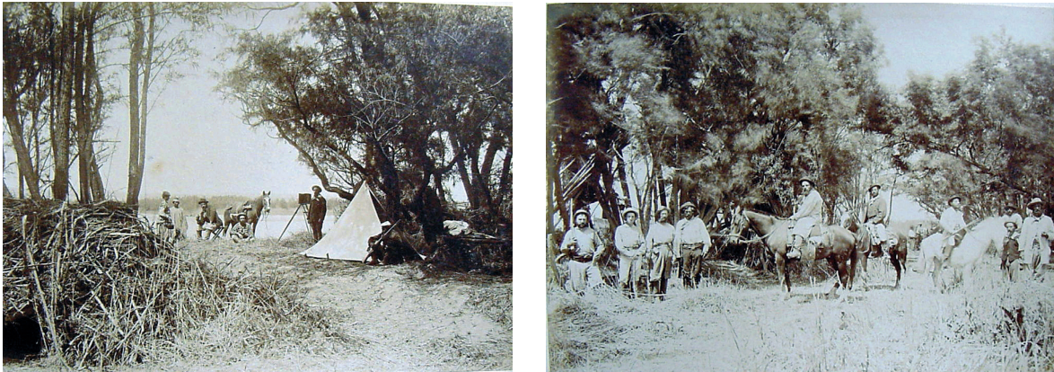
Figs 4 y 5

topográficas que llevaron a cabo, sino más bien la demostración de su mera presencia en una porción de la geografía patagónica, que es dominada por medio de dos prácticas distintas: el avance sobre ella y la captación fotográfica de las paradas durante ese tránsito. Pensemos que todo viaje connota desplazamiento espacial, pero también una travesía que se verifica en el tiempo, y esta dimensión temporal está ligada a su representación escrita e icónica, cada una con sus particularidades (Penhos, 2013a: 62). Vale la pena, entonces, considerar la capacidad de la fotografía para detener el movimiento (tanto en el sentido de recorrido espacial y de devenir), con el fin de brindar una fijación, en una versión estable, de las coordenadas espacio-temporales de la experiencia vivida por los expedicionarios. “Lo que se atestigua [en la fotografía], dice Frizot (2009: 72), es la presencia de un objeto, una persona, o una conjunción de presencias en el espacio” y, agregó, también en el tiempo.