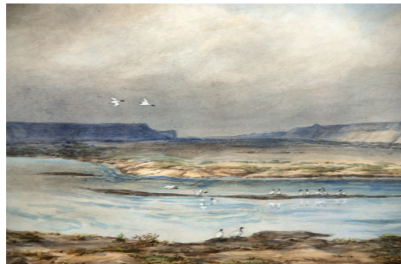
Figs 10 y 11

La obra de Methfessel es útil para referir a la apropiación simbólica de ciertas regiones por la doble vía de las operaciones técnico-científicas y artísticas. Integrada por dibujos de especies vivas y restos fósiles, pequeñas imágenes a la aguada que ilustran trabajos de excavación en sitios del noroeste argentino, y paisajes, la mayor parte a la acuarela de formato mediano, y otros en grandes cuadros al óleo, la producción de Methfessel se extiende por treinta años, desde su llegada al país en 1864 hasta su regreso a Suiza en 1895. Entre las acuarelas, las realizadas en la Patagonia (figs. 10 y 11), si bien corresponden a sitios ubicados más al sur que los que muestran las fotografías de Morelli, responden a una concepción espacial similar, en la cual la ausencia del hombre es total. El predominio de los azules en las aguas de ríos y lagos y el telón de fondo