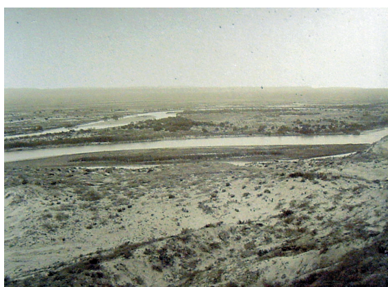
Figs 8 y 9

parecen perdidos y sin rumbo”. En efecto, es difícil dilucidar qué hacen los personajes en estas fotografías, sumidos en el plano inferior de la imagen o destacados contra el cielo: solamente están allí autorizando la toma desde “dentro”.