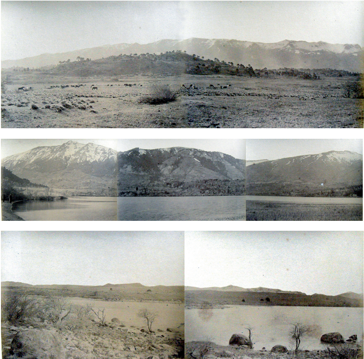
Sup. Fig. 12 - Medio: Fig. 13 - Inf. Fig. 14

datos que contienen las leyendas debajo de cada fotografía: nombre indígena del lugar, traducción del mismo, ubicación geográfica, descripción, altura barométrica. Pero esto no debería obturar la posibilidad de identificar qué es lo que de todos modos tienen de estético, incluso a pesar de sus productores. Y esto sin dejar de notar que, según consigna Vezub a lo largo de su trabajo, las imágenes del álbum parecen haber alcanzado cierta estima de Estanislao Zeballos y otros contemporáneos por sus merecimientos artísticos (Vezub, 2002: 25-27, 35 y 54).