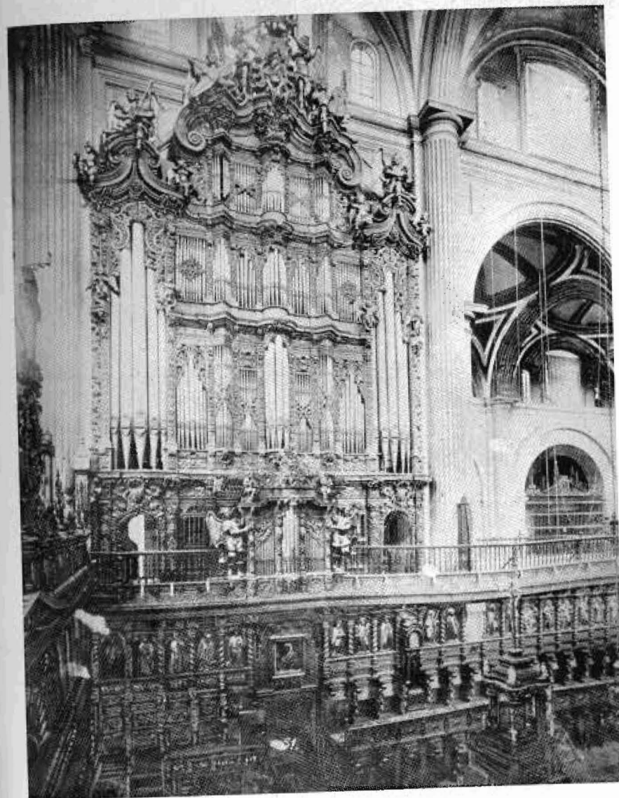
Organo de la Catedral de México, D. F.