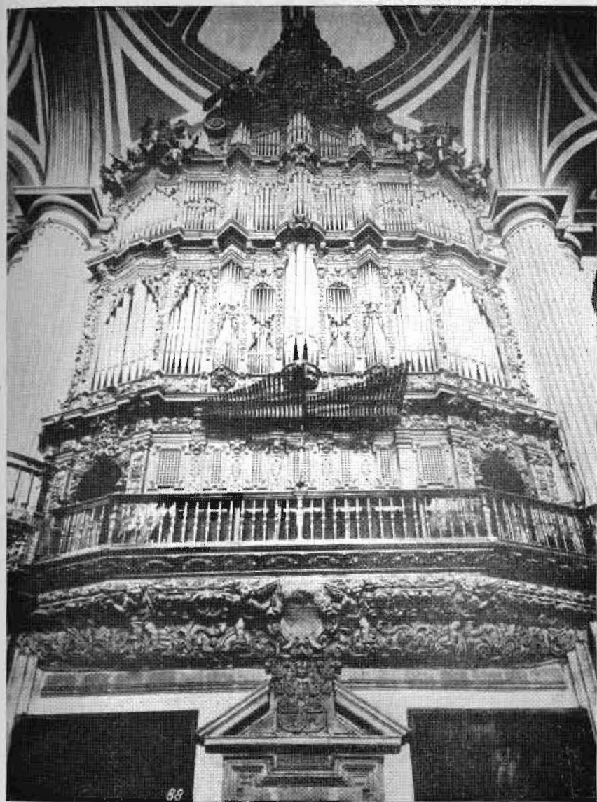
Organo de la Catedral de México, D. F.