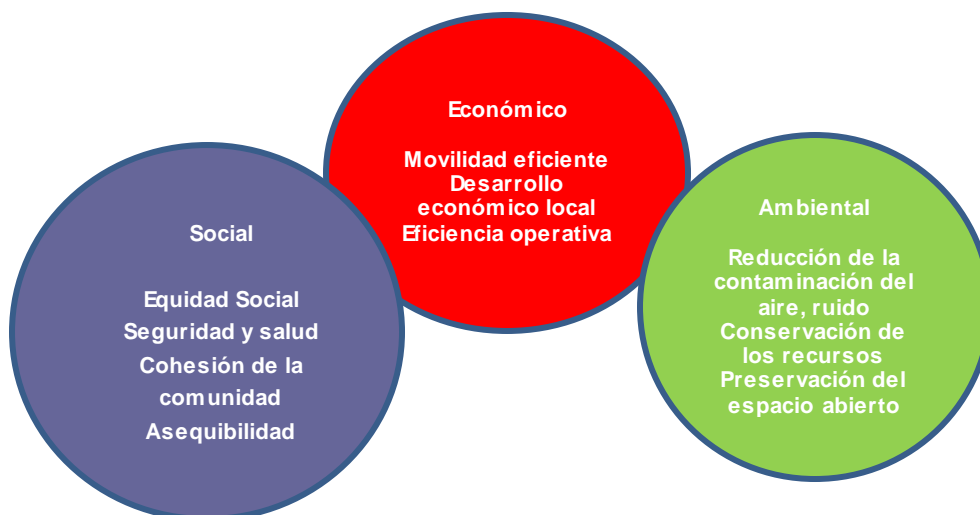
Figura N° 1. Objetivos del transporte sustentable